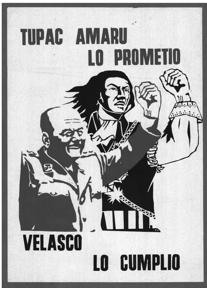
Imagen 1.3. Afiche con retratos de Juan Velasco Alvarado y Túpac Amaru. Instituto Internacional de Historia Social, Ámsterdam.