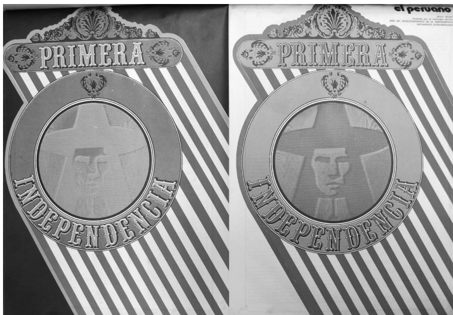
Imagen 1.5. Portadas de las dos secciones del suplemento por el sesquicentenario de la independencia publicado por el diario El Peruano (28 de julio de 1971).

apreciar como el acontecimiento más insólito en la vida nacional el redescubrimiento o exhumación de la figura de Túpac Amaru». 54 Su redescubrimiento tuvo lugar sobre todo en los ámbitos del discurso político y la simbología. Aunque existían valiosos precedentes (los trabajos de Carlos Daniel Valcárcel, entre otros), tomaría algunos años más para que los historiadores se pusieran al día en este «redescubrimiento», gracias sobre todo a los esfuerzos de Alberto Flores Galindo, Scarlett O’Phelan y, en años más recientes, Charles Walker. 55