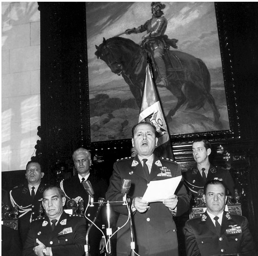
Imagen 1.1. El general Juan Velasco Alvarado pronuncia el discurso central de la conmemoración del sesquicentenario de la independencia del Perú (28 de julio de 1971).

segundo intento, pocos meses después, dio como resultado la elección de una marcha compuesta por Jaime Díaz Orihuela que luego fue grabada y editada en un disco de 45 rpm. 11 Un concurso de «música popular» relacionada con la independencia peruana y que abarcaba géneros como el vals, el huayno y la marinera fue declarado desierto dos veces. 12