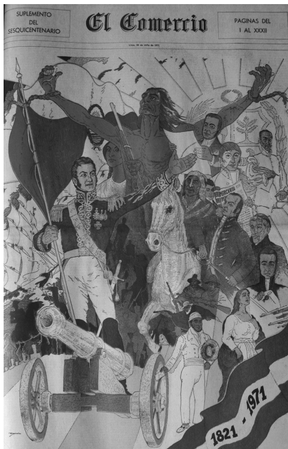
Imagen 1.4. Portada del suplemento especial de El Comercio para conmemorar el sesquicentenario de la independencia (28 de julio de 1971).

precursor de la Independencia»), pero claramente ocupó un lugar secundario en esta reconstrucción del proceso independentista. 51